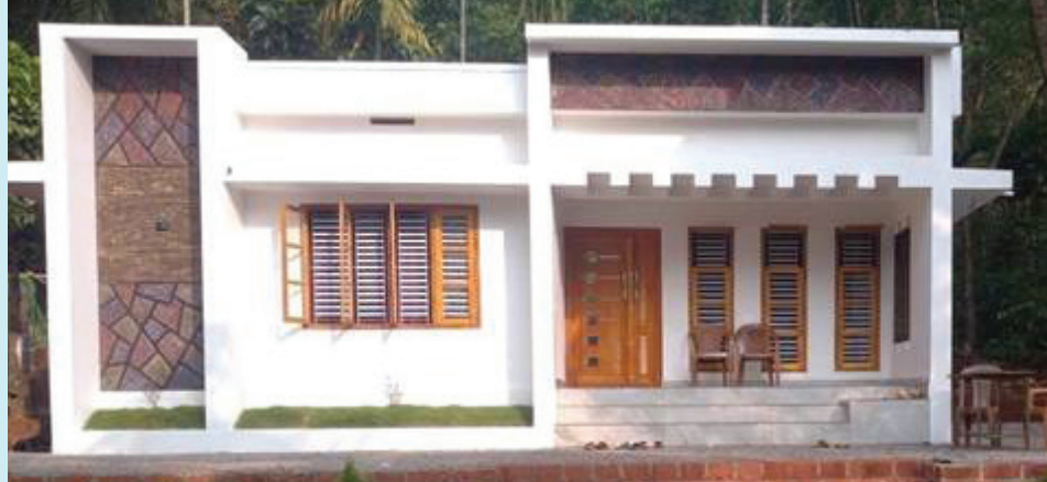
1896 ഗുണഭോക്താക്കളുടെ വീടുകളും

സംസ്ഥാന സർക്കാരിന്റെ സമ്പൂർണ്ണ പാർപ്പിട പദ്ധതിയിൽ ഇതുവരെ പൂർത്തിയാക്കിയിട്ട് 4,04,278 വീടുകൾ. കരാറിന് ലേർപ്പെട്ട 5,07,058 ഗുണഭോക്താക്കളിൽ 80 ശതമാനത്തോളം പേർക്ക് ഇതിനകം വീട് ലഭിച്ചു. ഇതിൽ 2023-24 സാമ്പത്തിക വർഷം 63518 വീടുകളാണ് പൂർത്തിയാക്കിയിട്ടുള്ളത്. 1,00,052 വീടുകളുടെ നിർമ്മാണം വിവിധ ഘട്ടങ്ങളിലായി പുരോഗമിക്കുകയാണ്. അതി ഭാരിദ്ര്യ നിർണ്ണയ പ്രക്രിയയിലൂടെ കണ്ടെത്തിയ ഗുണഭോക്താക്കളിൽ ഭവന നിർമ്മാണത്തിനായി കരാർ വെച്ച 3945 കുടുംബാംഗങ്ങളിൽ