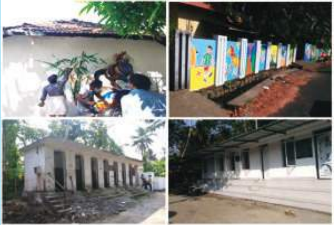
മാലിന്യത്തിൽ നിന്നും മനോഹാരിതയിലേക്ക് ഉള്ള ഏതാനും ചുവടുവെയ്പ്പുകൾ

ലുള്ള ചെടികളുടെ വേരുകൾ ഉപയോഗിച്ചുള്ള റൂട്ട്സ് സോൺ ട്രീറ്റ്മെന്റ് തുടങ്ങിയ പ്രവർത്തനങ്ങളിലൂടെ ദ്രവമാലിന്യത്തെ ശുദ്ധജലമാക്കി മാറ്റി കനാലിനേക്ക് കടത്തി വിടുന്നു.