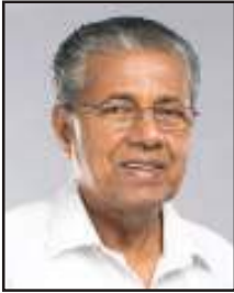
പിണറായി വിജയൻ മുഖ്യമന്ത്രി