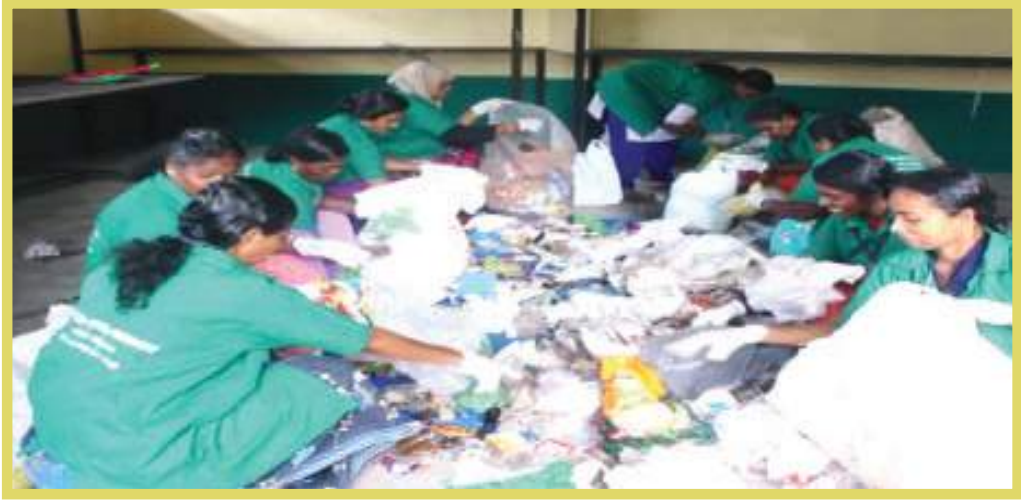
ഹരിതകർമ്മസേന അംഗങ്ങൾ എം.സി.എഫിലെത്തിയ പ്ലാസ്റ്റിക് മാലിന്യങ്ങൾ തരംതിരിക്കുന്നു.