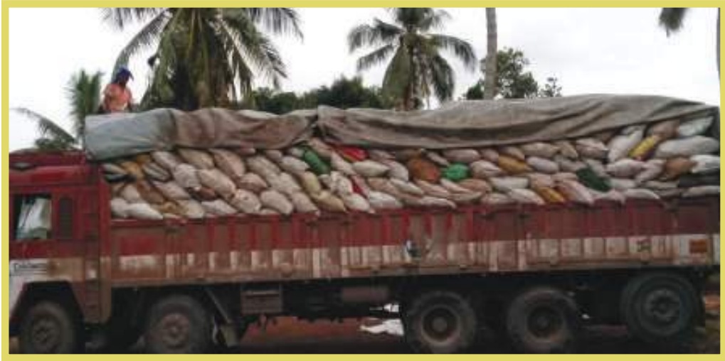
എ സി സി സിമന്റ് ഫാക്ടറിയിലേക്ക് അജൈവമാലിന്യം കയറ്റി അയക്കുന്നു

ത്തിൽ പഞ്ചായത്തുമായി കരാർ എഴുതിയാണ് പ്രവർത്തനമാരംഭിച്ചത്. വാർഡുകളിൽ നിന്ന് ശേഖരിക്കുന്ന മാലിന്യം എം സി എഫിൽ എത്തിച്ച് 58 ഇനങ്ങളിലായാണ് തരം തിരിക്കുന്നത്. വില ലഭിക്കുന്ന ഉൽപ്പന്നങ്ങൾ ആക്രി വ്യാപാരിക്ക് കൈമാറുന്നു. ഇതിനായി പഞ്ചായത്ത് വ്യാപാരിയുമായി പ്രത്യേക കരാറിൽ ഏർപ്പെട്ടിട്ടുണ്ട്.