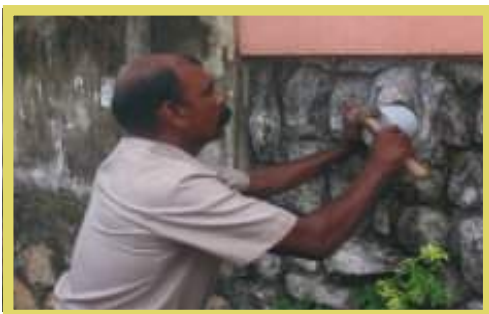
പൊതു സ്ഥലത്തേക്ക് തുറന്നുവെച്ച മാലിന്യപൈപ്പ് കോൺക്രീറ്റ് ചെയ്ത് അടയ്ക്കുന്നു.

കിള്ളിയാറിലേക്കും കൈത്തോടുകളിലേക്കും പൊതുസ്ഥലങ്ങളിലേക്കും ഓടകളിലേക്കും തുറന്നുവെച്ചിരിക്കുന്ന 450 മാലിന്യ പൈപ്പുകൾ അടയ്ക്കുകയും വീണ്ടും ഉപയോഗിച്ച എട്ട് പേർക്കെതിരെ നിയമനടപടി സ്വീകരിക്കുകയും ചെയ്തു. അറവു മാലിന്യം നി