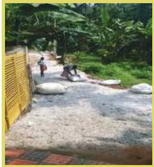
പൊടിച്ച് പ്ലാസ്റ്റിക് ഉപയോഗിച്ച് റോഡ് ടാറിംഗ്