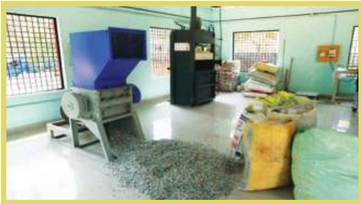
പ്ലാസ്റ്റിക് ഷ്രെഡിംഗ് യൂണിറ്റ് പ്രവർത്തനം

ബോധവൽക്കരണത്തിന്റെ ഭാഗമായി പൊതുസ്ഥലങ്ങൾ ശുചിയാക്കൽ, ശുചിത്വ ദീപം തെളിയിക്കൽ, എല്ലാ സ്കൂളുകളിലും ഹരിതോത്സവം, ശുചിത്വ സന്ദേശയാത്ര, എൻ.എസ്.എസ്. വിദ്യാർത്ഥികളുടെ റോഡ്ഷോ, ഭവനസന്ദർശനം, ശുചിത്വ ഭവനം തെരഞ്ഞെടുത്ത് ട്രോഫി നൽകൽ