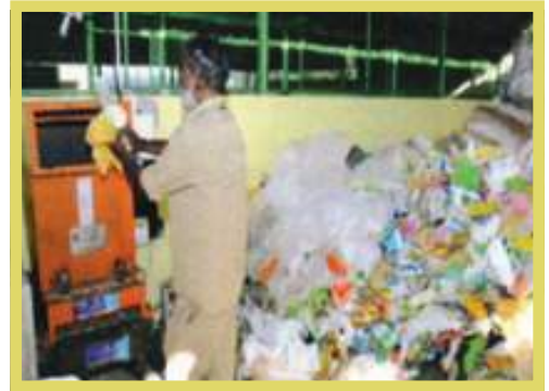
ബെയ്ലിംഗ് യൂണിറ്റും ഷ്രെസ്സിംഗ് യൂണിറ്റും