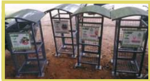
Collectors @ school Programme ന്റെ ഭാഗമായി ഗ്രാമപഞ്ചായത്തിലെ വിവിധ സ്കൂളുകളിൽ പ്ലാസ്റ്റിക് ശേഖരിക്കുന്നതിനുള്ള ബിന്നുകളും സ്ഥാപിച്ചു.

പ്രധാന ജംഗ്ഷനുകളിലും റോഡ് അരികിലും മാലിന്യം വലിച്ചെറിയുന്നതിനെതിരെ നിയമ നടപടികളുടെ മുന്നറിയിപ്പ് ബോർഡുകൾ സ്ഥാപിക്കുകയും, മാലിന്യം നിക്ഷേപിക്കുന്നവരിൽ നിന്നും പിഴ ഈടാക്കുകയും ചെയ്യുന്നു.