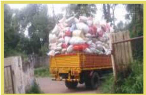
എം.സി.എഫിൽ ശേഖരിച്ച പ്ലാസ്റ്റിക് മാലിന്യങ്ങൾ നെടുമങ്ങാട് ആർ.ആർഎഫിലേക്ക് മാറ്റുന്നു.